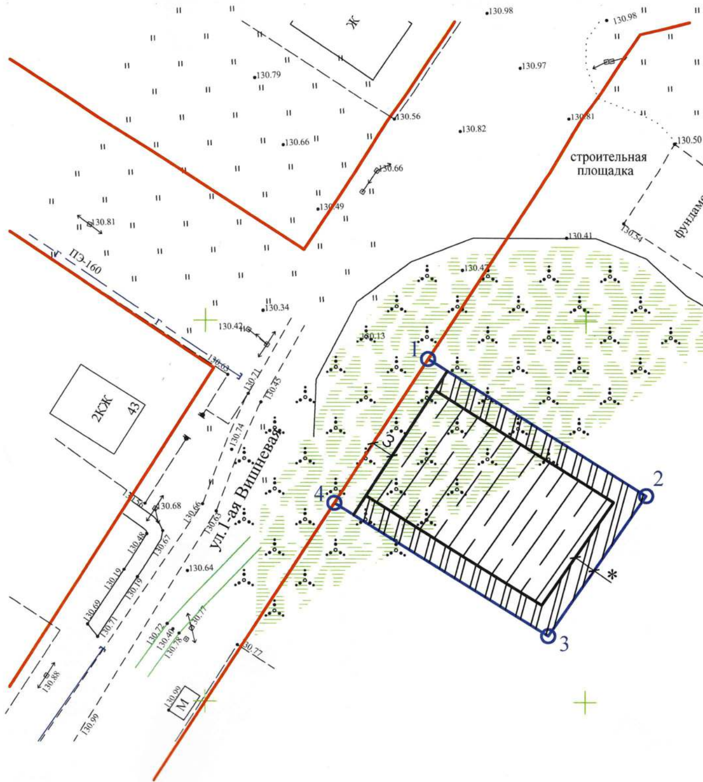
Экспликация существующих объектов капитального строительства, объектов незавершенного строительства