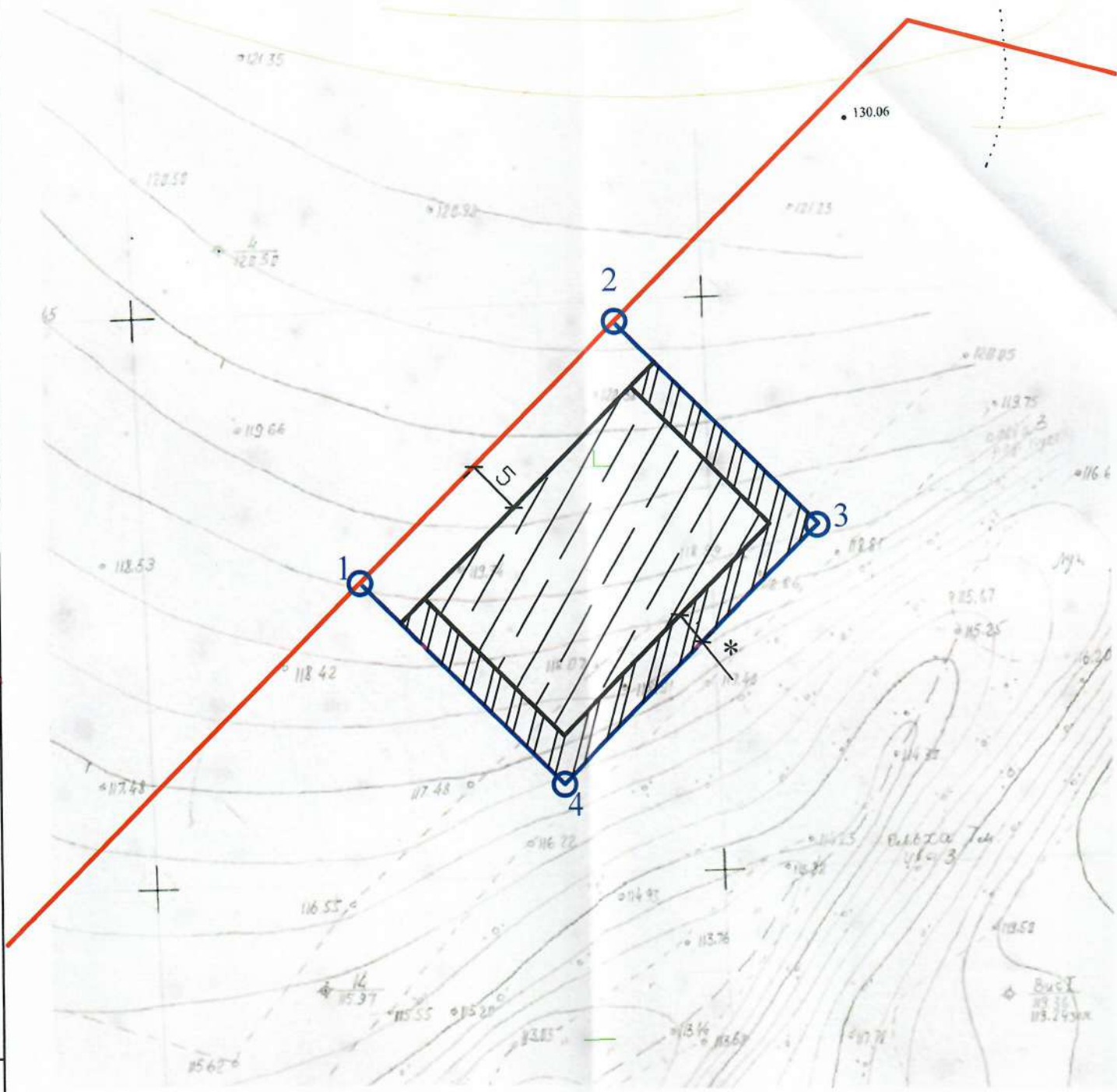
Ведомость координат поворотных точек земельного участка