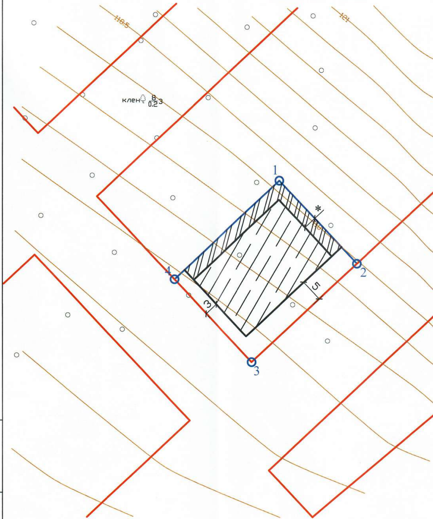
Экспликация существующих объектов капитального строительства, объектов незавершенного строительства