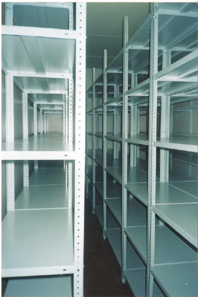
Вид архивохранилища в 1998 г.

Архивный отдел Администрации города Иванова (далее – архивный отдел) начал свою деятельность практически с «нуля».