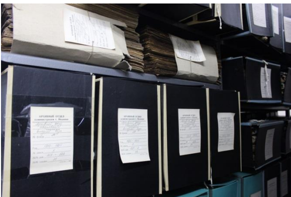
Архивохранилище в настоящее время

В 1996 году Государственным архивом Ивановской области в архивный отдел были переданы документы предприятий бытового обслуживания населения, предприятий общественного питания, треста «Ивгорстрой» – всего в количестве 2315 единиц хранения. На конец года количество дел, находящихся на хранении, составило 3344 единицы хранения. Площадь единственного архивохранилища – 55 кв. м.